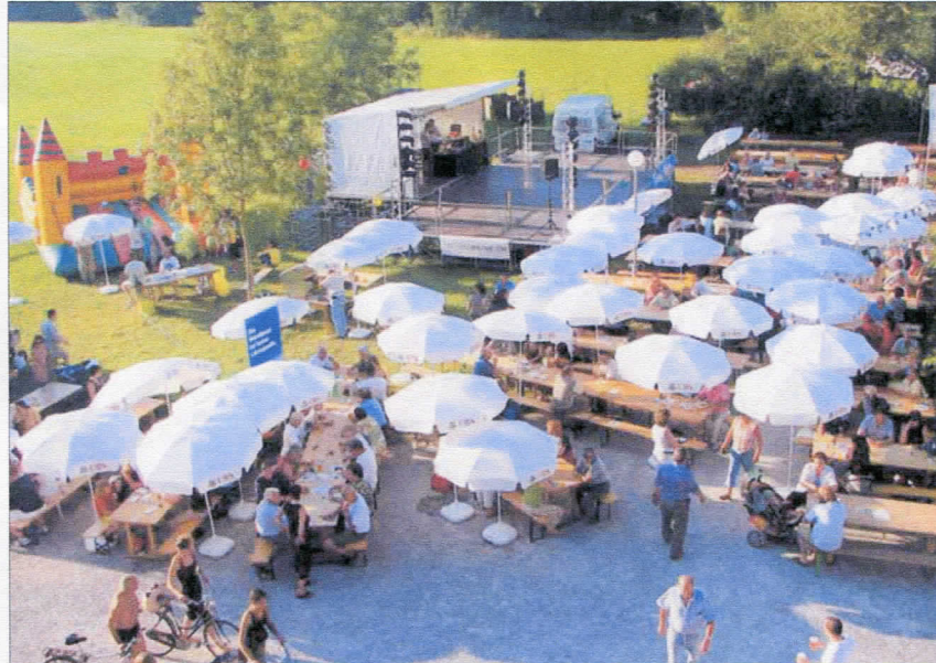
Am frühen Samstagabend füllte sich das idyllisch gelegene Festgelände langsam, aber sicher.

Unter dem Motto Tirol eröffnete das Trio Alpinas aus Österreich am Freitagabend das Fest mit stimmungsvoller Unterhaltungsmusik. Bis spät in die Nacht genossen viele Höngger die Gelegenheit, unter freiem Himmel zu tanzen, und schwingen rege das Tanzbein. Ein breites Programm am Samstag lockte trotz der Hitze wiederum zahlreiche Besucher an. Zur Erkundung der Insel wurden Rikschafahrten angeboten, die Kinder konnten das Naherholungsgebiet vom Rücken der Pferde aus bestaunen, wenn sie nicht gerade im Chascherli-Theater sassen oder