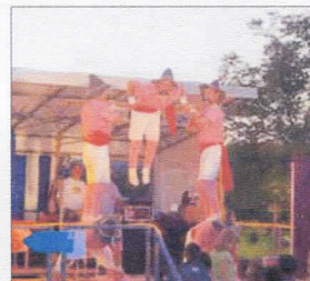
Herkules 1910 bot am Samstagabend eine witzige Akrobatik-Show.