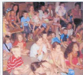
Die Aufführungen des Chascherli-Theaters lockten viele kleine Gäste an.

Das Fest wurde am Sonntag mit einem Langschläfer-Frühstück und Musik der Old Stompers Jazz-Band abgerundet. Am Abend wollten die Gäste das gemütliche Fest auf der Insel gar nicht mehr verlassen, die Organisatoren schlossen das Fest erst Stunden später als geplant.