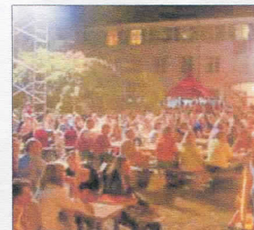
Bis auf den letzten Platz besetzt waren die Reihen während der Feuer-Show.