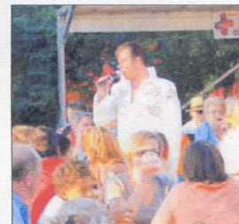
Der Elvis-Imitator scheute sich nicht vor Publikumsnähe.